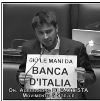
un altro la Banca d'Italia che sarebbe ... nostra!!!