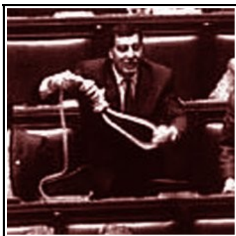
uno dal '93 difenderebbe la "giustizia"

l'Opposizione innova il parlamento: adesso ci si va per apparire in TV !!