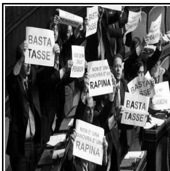
altri ancora le nostre tasche dalle tasse (!!!!)