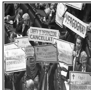
altri l'informazione che sarebbe "libera"!!!!

Basta con queste sceneggiate in parlatoio degli uni e degli altri !!! La verità è che se non siamo neanche in grado di arrivare a fine mese e di difendere le nostre condizioni di lavoro come facciamo a credere a questi sedicenti risolutori di spread , a questi sedicenti rinnovatori dell'Europa incapaci di rinnovare persino una locale circoscrizione? Il governo è impotente, l'opposizione sa solo abbaiare ma l'uno e l'altra non esitano a chiederci un voto "europeo" per renderci corresponsabili dei loro misfatti !!