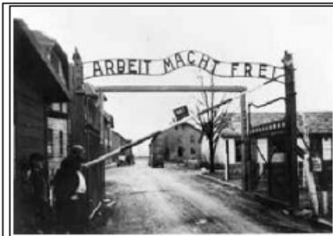
«il lavoro rende liberi»

Ripensando la «giornata della memoria», indetta per ricordare la barbarie dei campi di sterminio, non possiamo non rilevare come siano stati sottaciuti i Gulag di marca stalinista. Forse perché nei Gulag