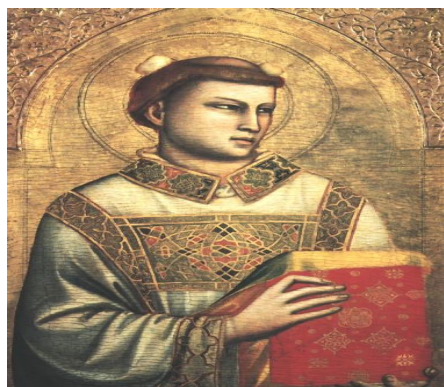
Chi predica bene ...

via alla Porta degli Archi, 3/1 - 16121 Genova tel. 0108622050 - www.sinbase.org - info@sinbase.org